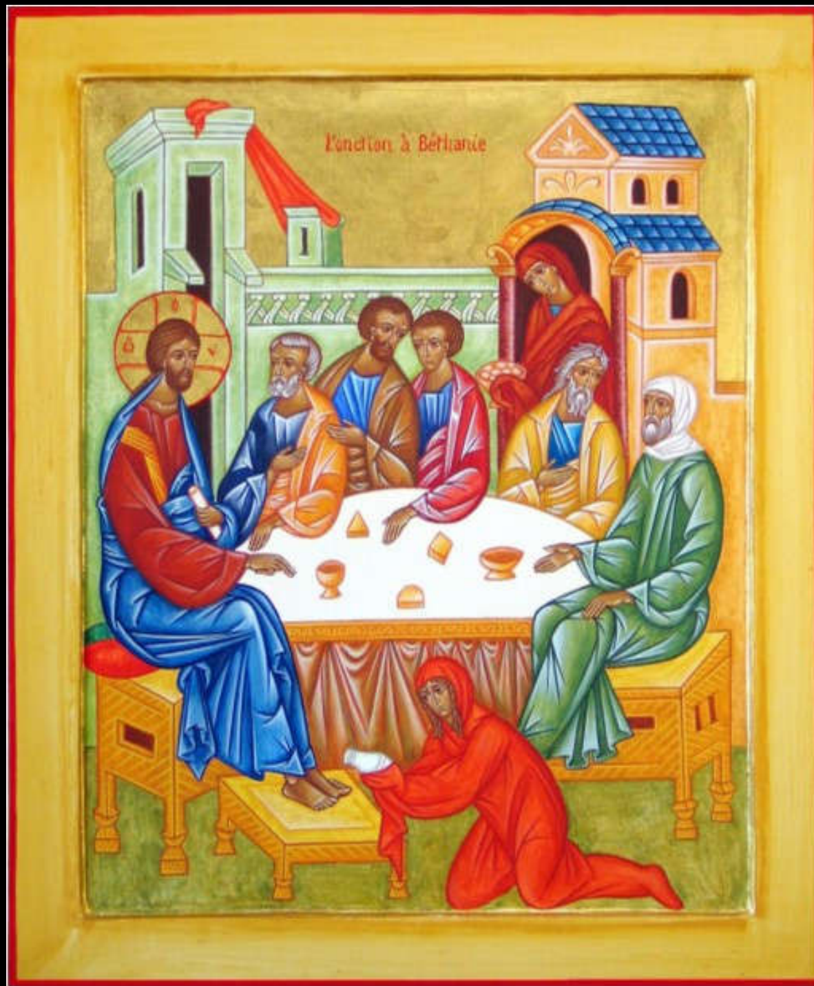
L'onction de Béthanie